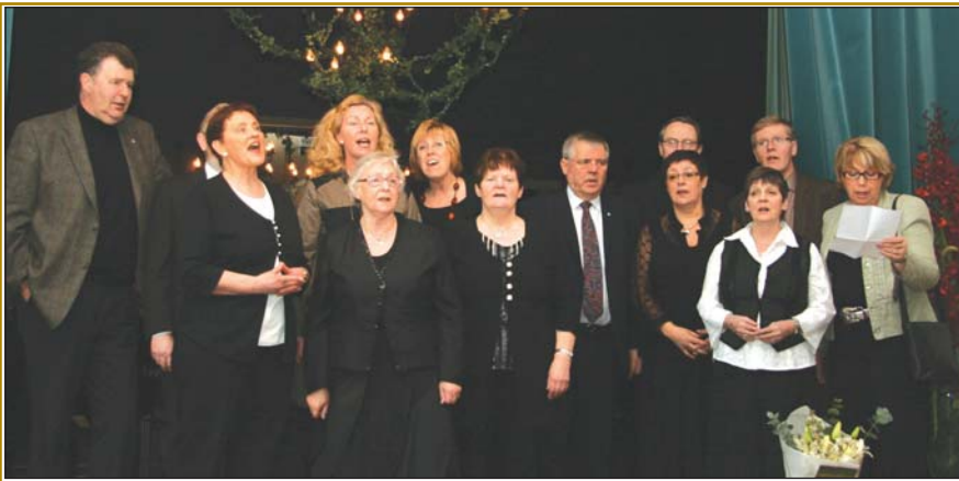
Kirkjukór Lágafellssóknar hefur þjónað kirkju sinni í 60 ár.