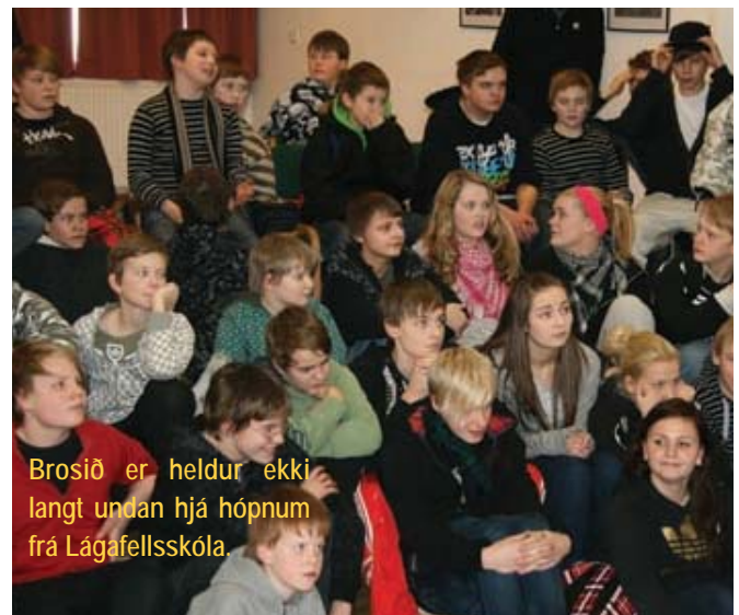
Brosið er heldur ekki langt undan hjá hópnum frá Lágafellsskóla.