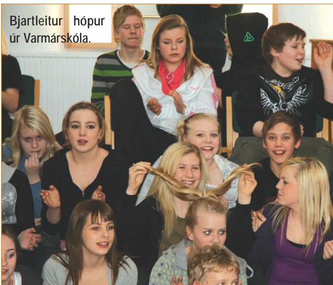
Bjartleitur hópur úr Varmárskóla.

með ágætum. Hóparnir fóru heim saddir og sælir af mat og upplifun og vonandi um margt fróðari. Skálholtsskóli á þakkir skilið fyrir góðar viðtökur og viðurgjörning.