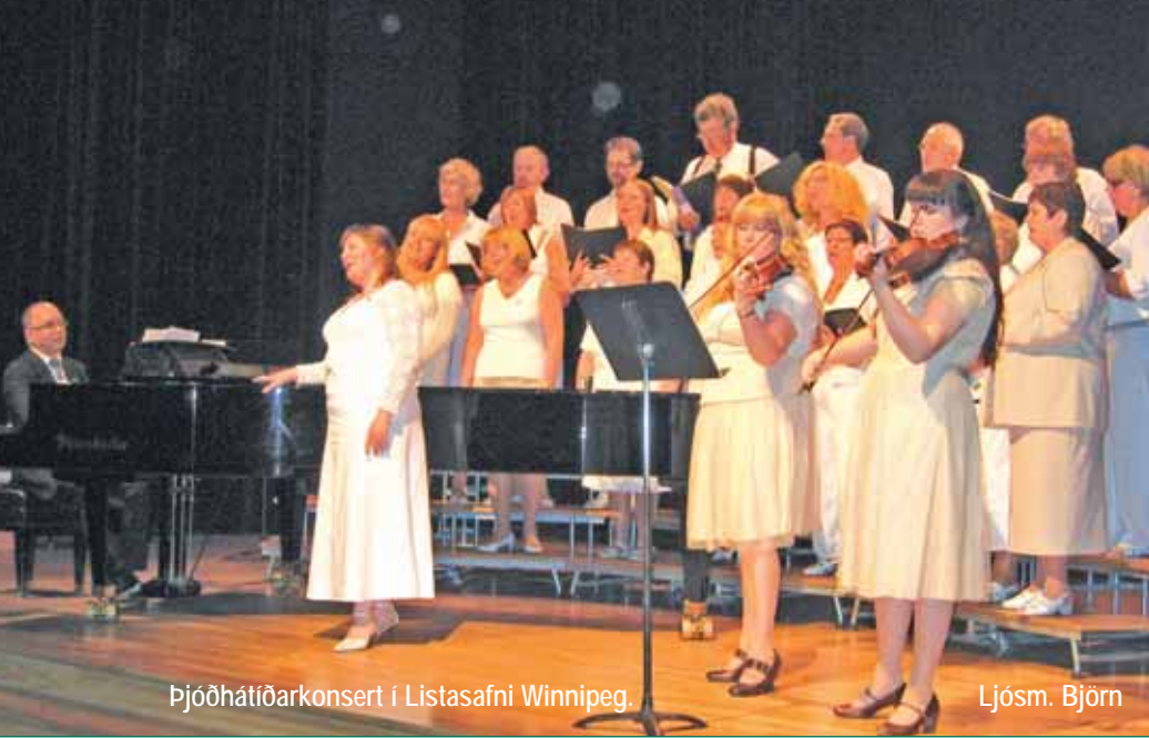
Þjóðhátíðarkonsert í Listasafni Winnipeg.