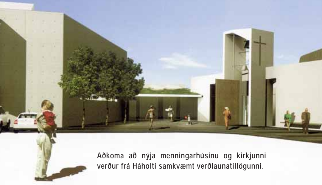
Aðkoma að nýja menningarhúsinu og kirkjunni verður frá Háholti samkvæmt verðlaunatillögum.

S emma á þessu ári var efnt til hugmyndasamkeppni um kirkju og menningarhús í Mosfellsbæ. Alls bárust 32 tillögur og hlutu fjórar þeirra verðlaun og sú fimmta viðurkenningu.