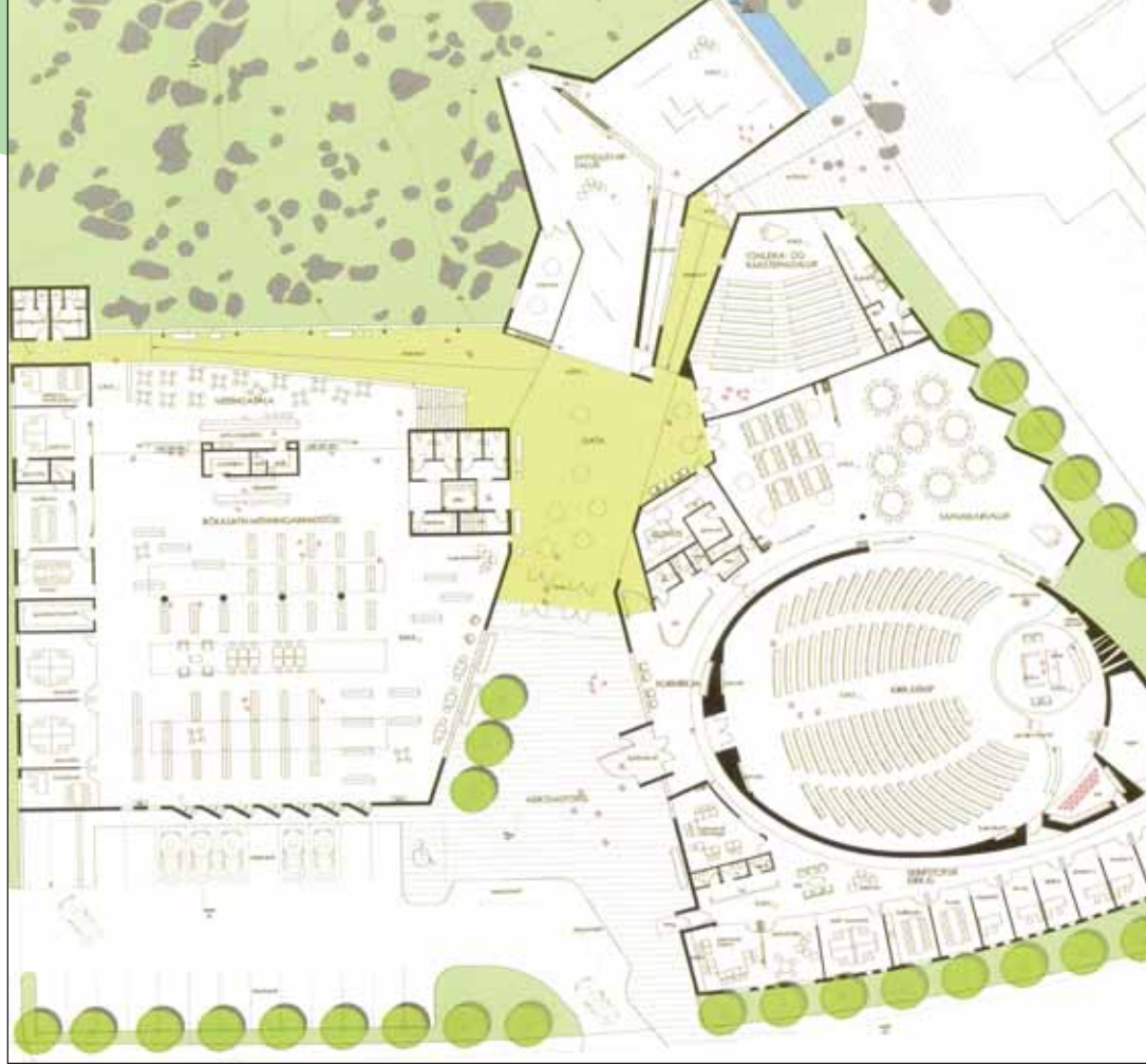
Á teikningunni hér að ofan má sjá hvernig sameiginlegt rými nýtist fyrir kirkju, skrifstofur safnaðarins og bókasafn með aðkomu frá einu torgi. Á neðri myndinni sést hvernig byggingin skipar sér í landslagið og þá byggð sem fyrir er á staðnum, en á myndinni á forsiðu má einnig sjá fyrirhugaðan bilakjallara sem að hluta tekur við akandi umferð að menningarhúsinu.