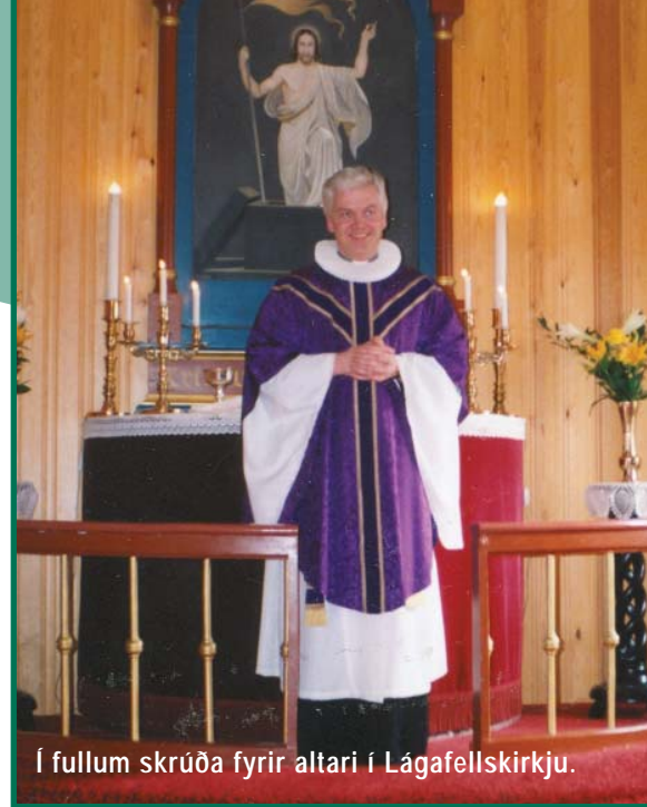
Í fullum skruða fyrir altari í Lágafellskirkju.