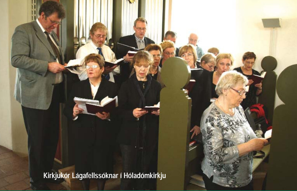
Kirkjukór Lágafellssóknar í Hóladómkirkju