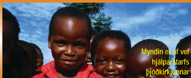
Myndin er af vef hjálparstarfs þjóðkirkjunnar

3. nóvember s.l. gengu fermingarborn í Lágafellssókn í hús og söfnuðu fé til og hjálparstarfs í Úganda á vegum kirkjunnar. Alls söfnuðust 232.950 krónur sem er um ¾ hlutar þeirrar upphæðar sem fékkst fyrir ári, en þetta mun vera í níunda sinn sem fermingarborn sinna þessu verkefni í samráði við uppfærðendur sína.