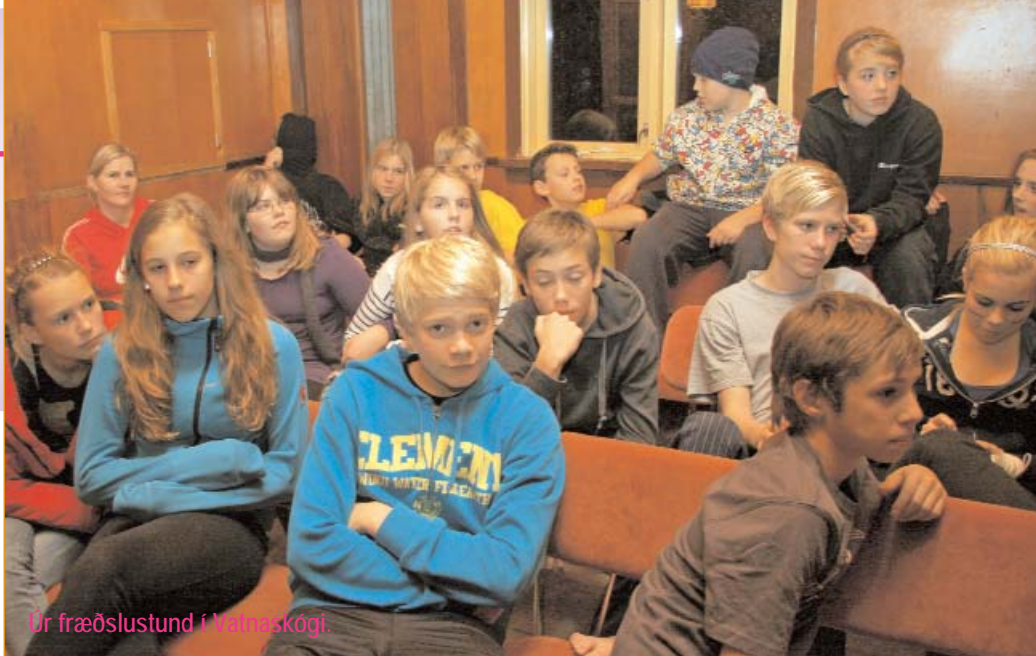
Úr fræðslustund í Vatnaskógi.

Þegar undirbúningur fermingarfræðslunnar hefst á hverju hausti er bréf sent tilvonandi fermingarbörnum og foreldrum þeirra þar sem ferðin er kynnt og hvað hafa beri í huga þannig að hún komi að sem bestu gagni. Foreldrum er einnig boðið að taka þátt í ferðinni sem sjálf-