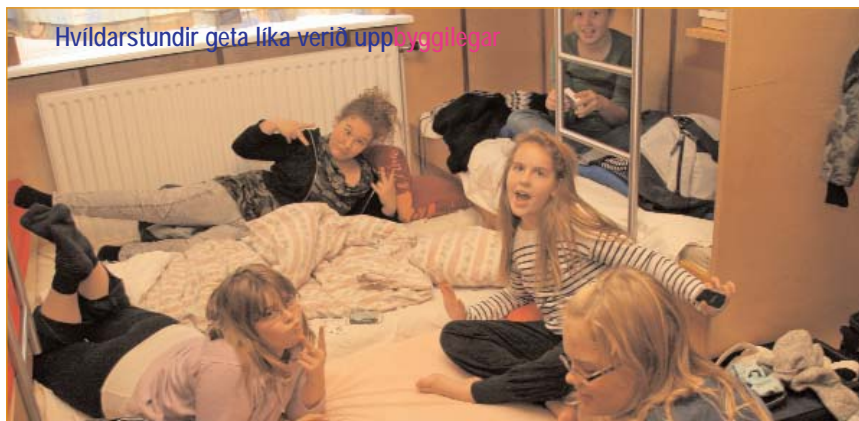
Hvildarstundir geta líka verið uppbyggjar.

Eftir morgunverð á þriðjudeginum er búið undir helgistund sem er síðasta atriði á dagskrá náms- og skemmtiferðarinnar í Vatnaskóg. Hún er haldin í Saurbæjarkirkju, sem helguð er minningu Hallgríms Péturssonar og kölluð Hallgrímiskirkja. Að helgistundinni lokinni er haldið heim í Mosfellsbæ á ný og komið þangað síðdegis, reynslunni ríkari.