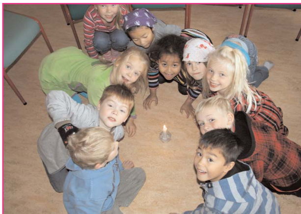
Kátína og ljúf gleði er ríkjandi hjá kirkjukrókkum.