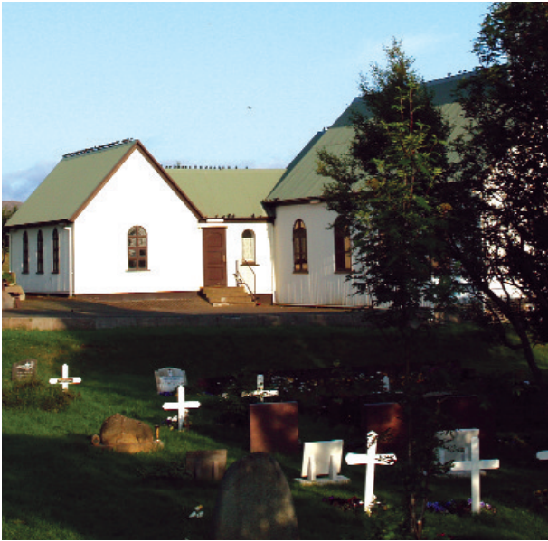
Þema Menningardags Kjalarnesprófastsdæmis er „opnar kirkjur“. Eins og myndin sýnir eru þó þeir kirkjugestir til sem kjósa heldur að tylla sér á þakið.