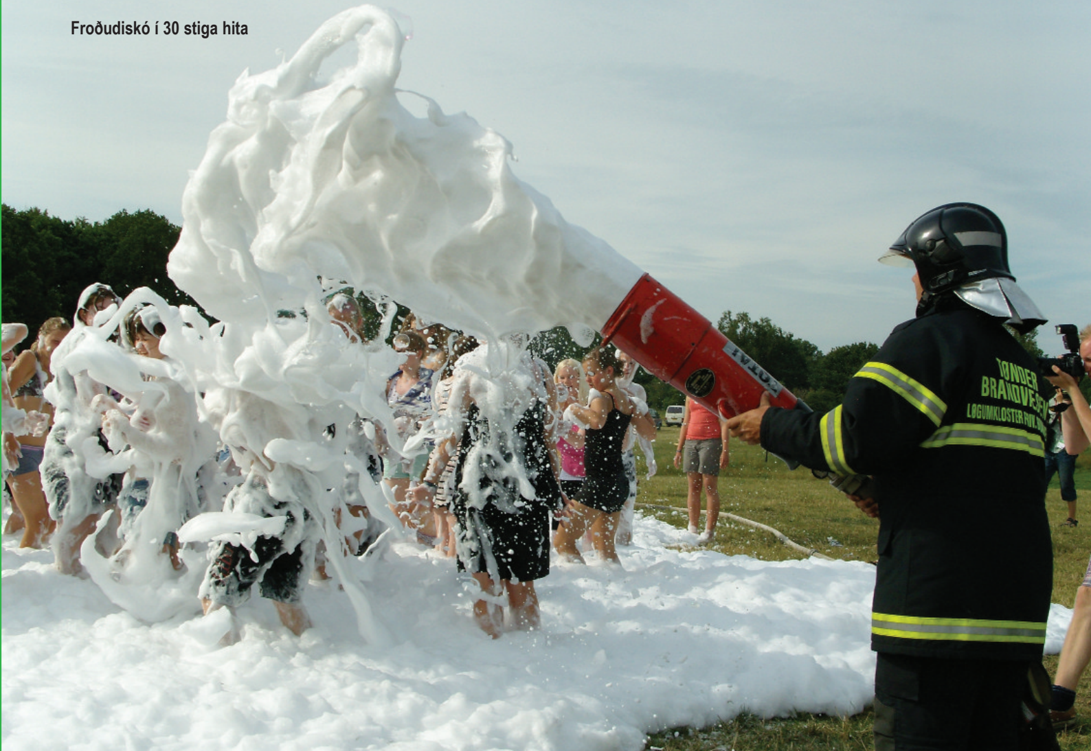
Froðudiskó í 30 stiga hita