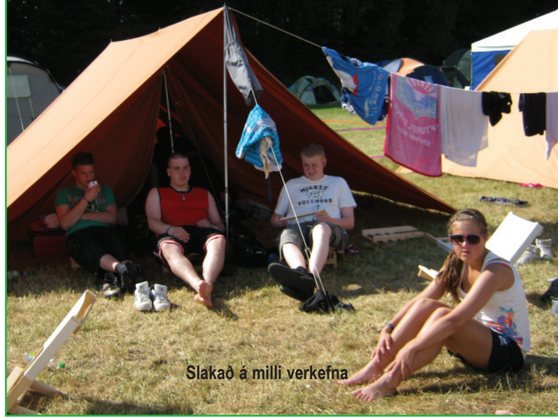
Slakað á milli verkefna

Oft er sagt að myndir segi meira en þúsund orð, hér má því sjá nokkrar myndir úr ferðinni.