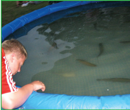
Unnar veiðir í matinn – með höndunum

Í sumar tók hópur ungmenna frá æskulýðsstarfi Lágafellskirkju þátt í æskulýðsviku KFUM & KFUK í Danmörku. Mótið var haldið á Suður-