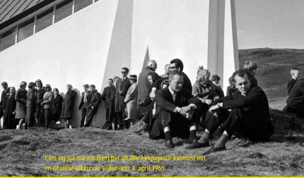
Eins og sjá má var fjarri því að allir kirkjugestir kæmst inn, en til allrar lökku var veður gott 4. apríl 1965.

á Lágafelli. Það er til marks um þakklæti Stefáns í garð dalsins sem opnaði honum ungum faðm sinn að hann gaf honum nýtt guðshús í kveðjugjöf.